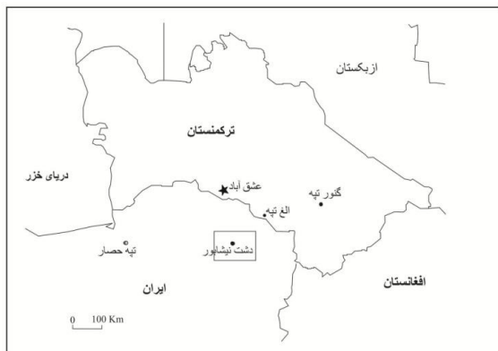
تصویر (1): موقعیت مکانی دشت نیشابور در شمال شرق ایران

سطح دریا حدود 1250 متر است. شهرک فیروزه که نامش برگرفته از مجتمع‌های مسکونی تازه‌ساز در غرب شهر فعلی نیشابور است، در پهنه شرقی رودخانه فاروب رومان قرار دارد. این رودخانه به عنوان مهم‌ترین جریان آبی نیشابور از ارتفاعات بینالود سرچشمه می‌گیرد (تصویر 2). فاروب رومان که از رودخانه‌های مستقل زیر حوزه کویر مرکزی محسوب می‌شود، در فصول پر باران سیلابی می‌شود (فرهنگ جغرافیایی رودهای کشور، 1383). به دلیل شیب زیاد دشت با سیلابی شدن فاروب رومان و دیگر رودخانه‌ها مقدار زیادی آبرفت حمل می‌شود که با کم شدن شیب دشت رفته‌رفته ته نشست شده و در فرایندی بلند مدت افزایش چشمگیری می‌یابد. ابعاد استقرار شهرک فیروزه نامشخص است. زیرا زیر نهشته‌های آبرفتی مدفون بوده و ثانیاً بر اساس مطالعات اولیه، حجم عمده‌ای از آن زیر منازل مسکونی مردمان نیشابور است.