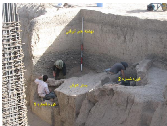
تصویر (4): نمایی از برش VII حین کاوش که دیواره‌های برش گویای رسوب‌گذاری متعدد رودخانه فاروب رومان هستند.

درون فضاهای دست‌کند مملو از نهبشته‌های آبرفتی است. با نگاهی به دیواره‌های برش لایه‌ای سیلابی به ضخامت حدود یک متر مشاهده می‌شود [تصویر (5) کانتکست 5]. این لایه در عمق 150 تا 220 سانتی‌متری نسبت به سطح زمین‌های اطراف زیر دیگر نهبشته‌های آبرفتی قرار دارد [تصویر (5) کانتکست‌های 1-3].