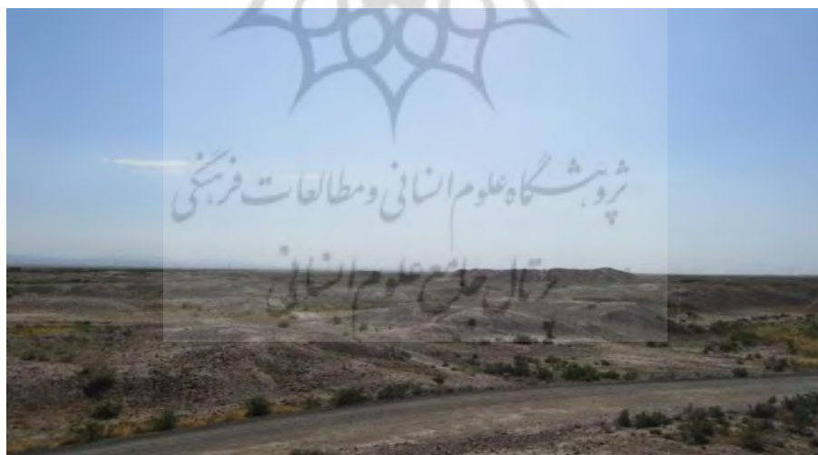
شکل 3 نمایی از تپه ماهورهای متعدد بوژگان (دید از میانه محوطه)

یکی از مهم‌ترین مناطق خراسان جام/ زام نام دارد که همواره از توابع نیشابور بوده است. در بازه زمانی پژوهش حاضر، مرکز زام بوژگان بوده که در متون به‌صورت‌های گوناگون مانند بوزجان یا بوزگان آمده است. محوطه تاریخی بوژگان 7 در میان دشت نیل‌آباد به فاصله 17 کیلومتری جنوب شرق تربت جام و در مسیر مسقیم به فاصله 210 کیلومتری شهر کهن نیشابور قرار دارد. نهشته‌های بوژگان در طول 35 درجه و 10 دقیقه و 42 ثانیه و عرض 60 درجه و 44 دقیقه و 35 ثانیه جغرافیایی قرار دارند و به‌صورت تپه ماهورهای (شکل 3) متعدد با وسعتی بالغ بر هزارمترمربع برآورد می‌شوند که به‌دلیل فعالیت‌های انسانی مانند کشاورزی و جاده‌سازی آسیب فراوان دیده‌اند (شکل 3).