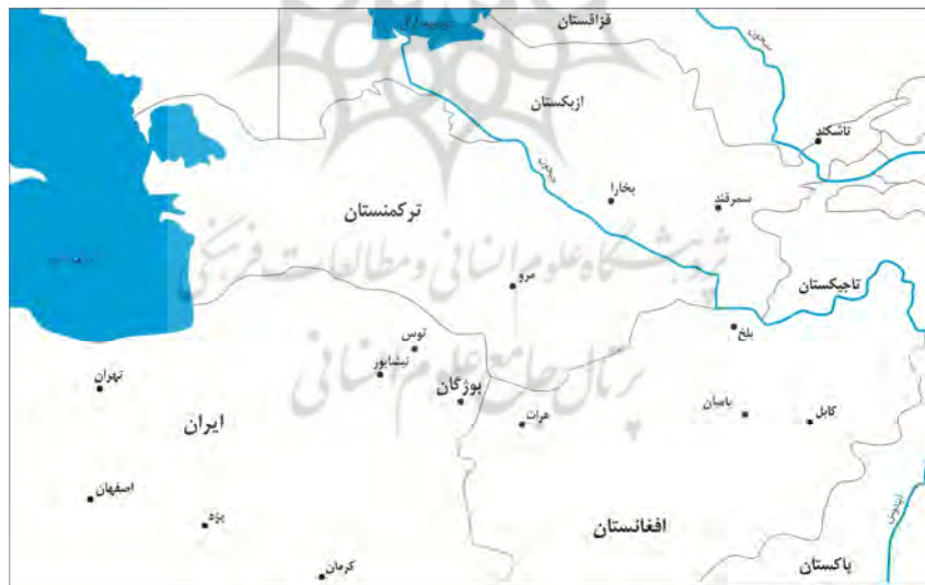
شکل 1 موقعیت مکانی استقرارهای مهم دوران اسلامی خراسان بزرگ

جهان‌گردان در قرن‌های نوزدهم و اوایل قرن بیستم میلادی سبب شد تا اولین کاوش‌های باستان‌شناختی در شهر کهن نیشابور آغاز شود (ریاضی، 1371: 22). سرپرست این کاوشگران که از طرف موزه متروپولیتن به نیشابور اعزام شده بودند، چارلز کیرل ویلکینسون بود که با روی‌کرد عتیقه‌جویی بین سال‌های 1935-1948م/1315-1326ش در تپه‌های سبزپوشان، مدرسه، تاکستان و قنات تپه کاوش کرد و نیمی از مواد فرهنگی یافت‌شده را به موزه ایران باستان و نیمی دیگر را به موزه متروپولیتن منتقل کرد (ر.ک: ویلکینسون، 1390: Allan, 1982; Wilkinson, 1986). کاوش‌های هیئت آمریکایی همسو با منابع مکتوب (حاکم نیشابوری 1375؛ مقدسی 1361؛ ابن‌خرداذبه، 1371) 3 نشان داد که نیشابور در دوران اسلامی اهمیت بسیاری داشته است. اهمیت نیشابور باعث شد تا بار دیگر در سال 1347 سیف‌الله کامبخش فرد (1349: 16) در کاوشی 22 روزه چندین کوره سفال‌پزی در آنجا بیابد که نشان از فرایند کاملاً تخصصی تولید سفال در نیشابور دارد. ریچارد بولیه 4 (1976) نیز در سال 1344 با روی‌کردی تحقیقی-تاریخی و هم‌پوشانی با بررسی باستان‌شناختی و مطالعات سنجش از دور، محلات شهر قدیم نیشابور را بازسازی کرد (شکل 2). مطالعه وی امروزه نیز با توجه به آسیب فراوان نهشته‌های باستانی، بسیار ارزشمند است.