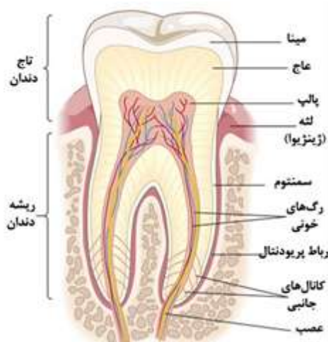
تصویر ۱: آناتومی دندان انسانی

با توجه به اینکه اثبات‌شده، عناصر دندان می‌تواند بسته به منبع غذا، آب و همچنین از خاک و جذب پوستی متفاوت باشد (Eskin, 2016: 149) و همچنین تراوا بودن ساختارهای دندانی نسبت به موادی که در محیط مجاور آن‌ها قرار می‌گیرد، به نظر می‌رسد که با ارزیابی عناصر موجود در دندان‌های قدیمی به‌دست‌آمده بتوان اطلاعات مفیدی در زمینه نوع و الگوی زنده انسان‌های گذشته به دست آورد. همچنین با مقایسه مقادیر به‌دست‌آمده از دندان‌های انسان‌های گذشته با انواع به‌دست‌آمده از انسان‌های معاصر می‌توان از تفاوت‌های موجود در شیوه زندگی بین نسل‌های مختلف و به‌خصوص منابع غذایی آگاه شد. در این مقاله ما به‌اندازه گیری و مقایسه غلظت عناصر معدنی موجود در نمونه‌های دندانی امروزی و پیش‌ازتاریخی خواهیم پرداخت. نتایج این مطالعه اطلاعاتی در خصوص نوع تغذیه و تغییرات غلظت عناصر در نمونه‌های دندانی به دست خواهد داد.