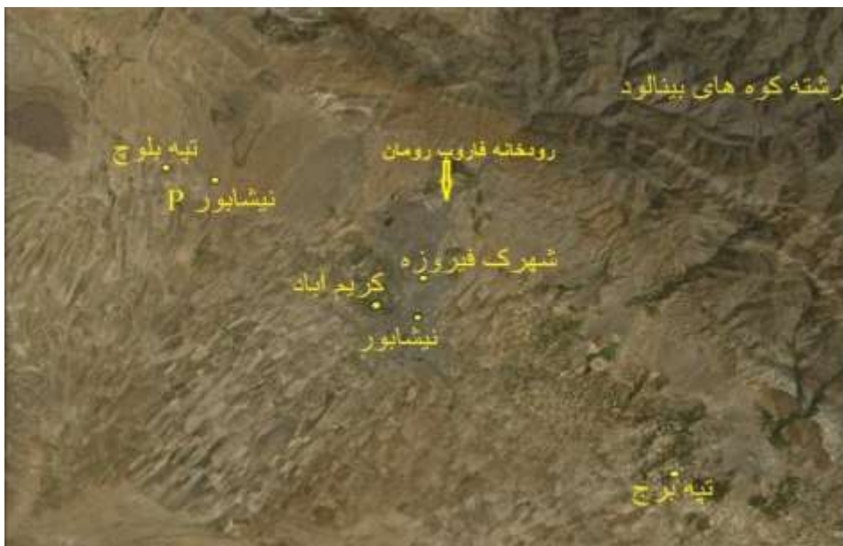
تصویر ۲: موقعیت جغرافیایی استقرار شهرک فیروزه و دیگر استقرارهای پیش از تاریخی دشت نیشابور