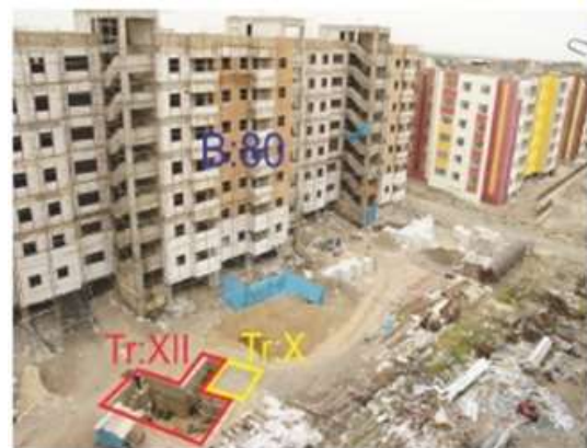
تصویر ۳: موقعیت ترانسه های X و XII در بین بلوک های ساختمانی