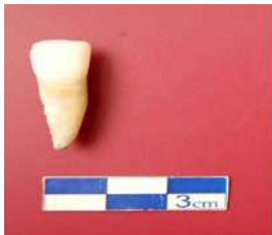
تصویر ۵: نمونه دندانی شماره ۵ معاصر