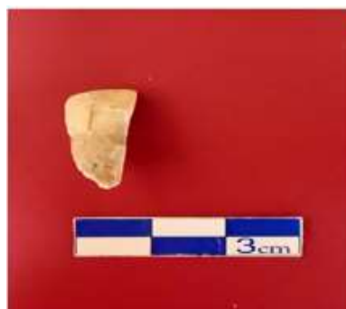
تصویر ۴: نمونه دندانی شماره ۱ محوطه